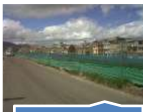
Avenida 9 desde calle 170 hasta calle 147