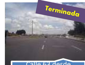
Calle 63 desde Avenida Ciudad de Cali hasta Trv 93