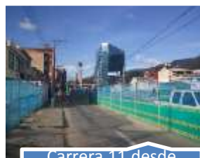
Carrera 11 desde calle 106 hasta Avenida 9