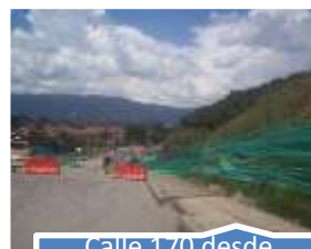
Calle 170 desde Avenida Boyacá hasta carrera 91