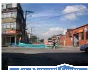
Av. Mariscal Sucre desde calle 19 hasta calle 62