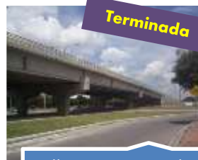
Calle 63 con Avenida Ciudad de Cali