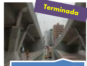
Carrera 15 con calle 100