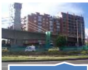
Carrera 11 con Avenida 9