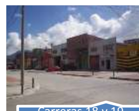
Carreras 18 y 19 desde calle 6 hasta calle 1