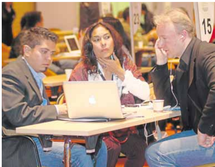
Un selecto grupo de la industria audiovisual del país se dio cita en el BAM.

Si usted también desea optimizar sus procesos y aumentar la competitividad de su empresa, acceda a este nuevo programa. Comuníquese al PBX: 3817000, ingrese a www.ccb.org.co (Apoyo Empresarial / Programa Tutor) o acérquese a cualquiera de las sedes de la Cámara de Comercio de Bogotá.