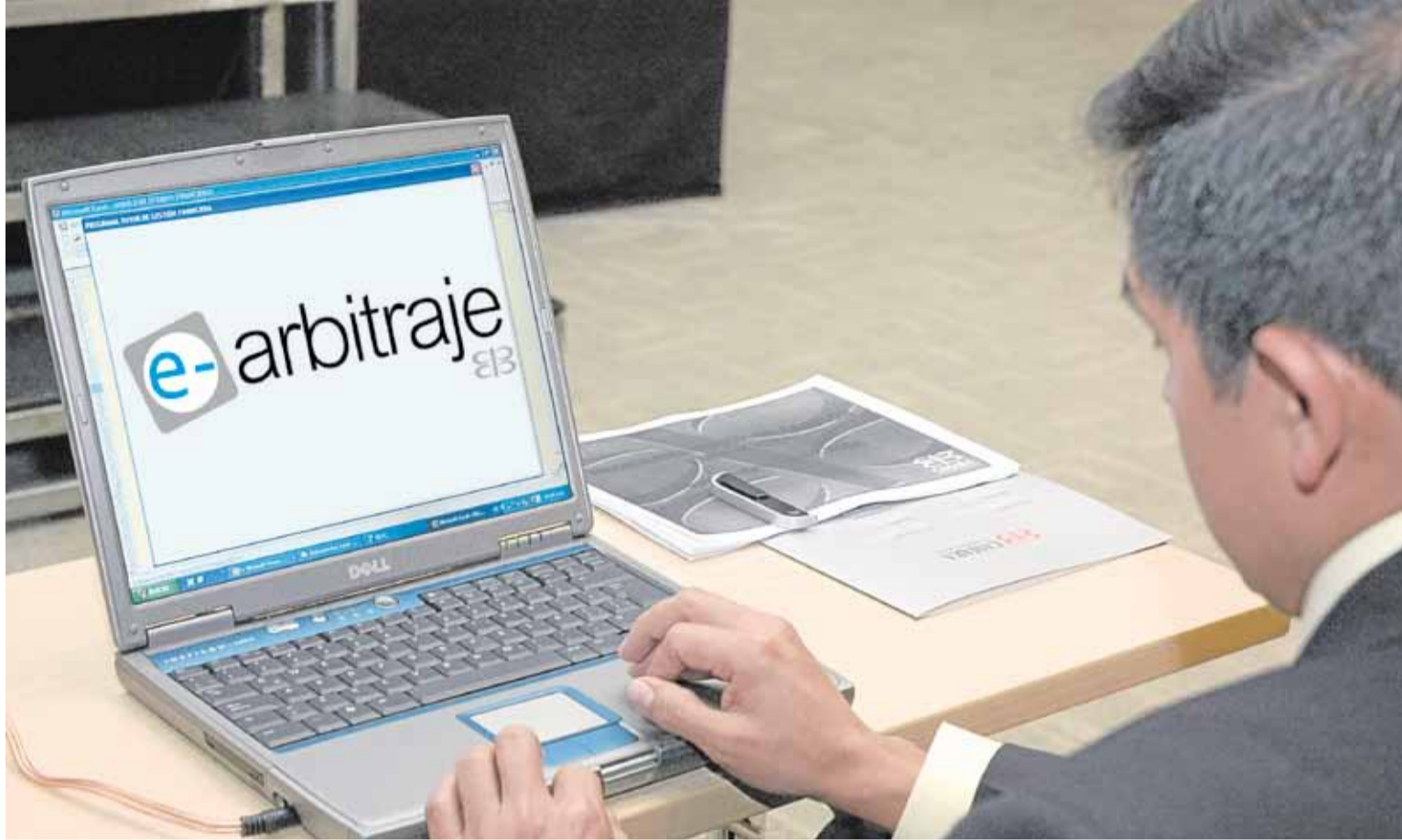
Desde cualquier lugar y en línea, se pueden administrar los casos de arbitramento vía virtual.