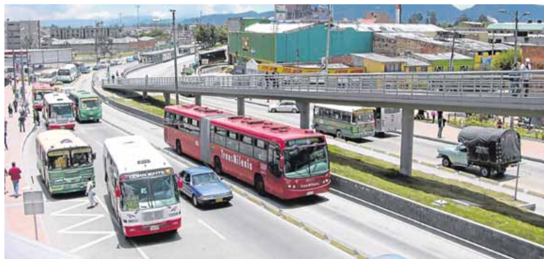
La Fase III de Transmilenio es uno de los proyectos estratégicos de movilidad en la ciudad.

Mayor información sobre el programa de Movilidad de la Cámara de Comercio de Bogotá en www.ccb.org.co sección Bogotá y su entorno.