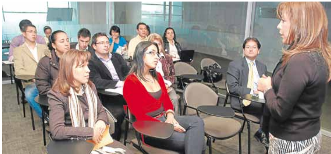
En el RUP se deben inscribir las empresas que aspiran contratar con el Estado.

"Para ser la primera vez que se organiza un evento de estos hay una buena nómina de personajes internacionales y considero que es una buena iniciativa de la CCB apoyar este sector".