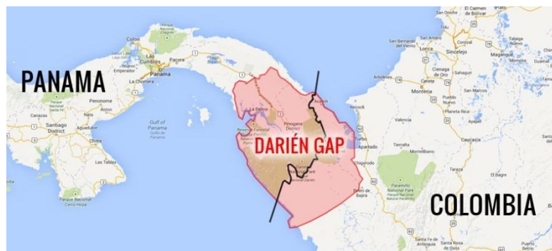
Imagen 1 Paso fronterizo entre Colombia y Panamá por el Darién (NPI MotoAventura, 2016)

calzado y textil, esto ha generado una incompatibilidad entre los gobiernos y el comercio de Panamá y Colombia, motivo del cual retrasa aún más la proyección del proyecto.