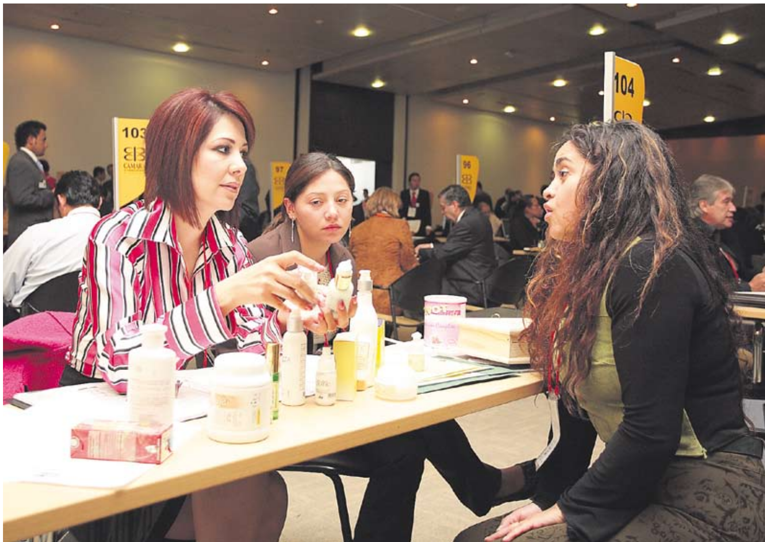
Los costos de participación en la Gran Rueda oscilan entre $50.000 y $75.000 por empresa.

Ingresa al mercado externo con el apoyo de la Cámara de Comercio de Bogotá. Participe en la Gran Rueda Internacional de Negocios de la CCB, que se realizará el 15 y 16 de septiembre, así como en las actividades de información, asesoramiento y promoción del comercio que organiza la entidad para que amplíe su oferta exportable.