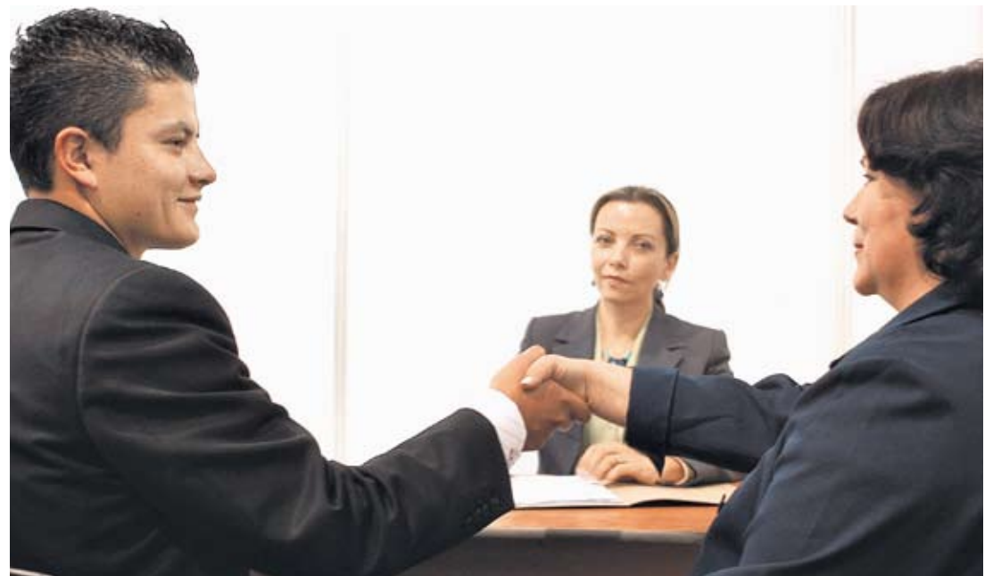
Momentos de una audiencia de conciliación

ubicadas en Engativá, Kennedy, Ciudad Bolívar y Soacha - Cazucá, en el Centro de Arbitraje y Conciliación Sede Salitre y Centro o en cualquiera de las Sedes Comerciales de la entidad. Más información al teléfono: 3830330 ext. 2312 - 2321 - 2328 o al correo electrónico: jornadas@ccb.org.co