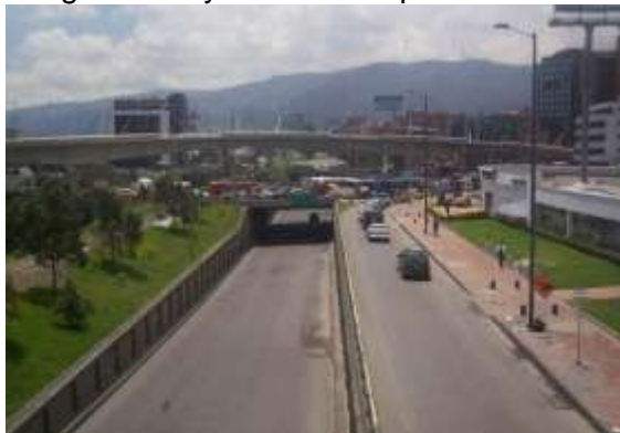
Imágenes 19 y 20. Avance puente vehicular calle 100 con carrera 15

Hacen parte de este contrato las dos obras de la carrera 11 con calle 106.