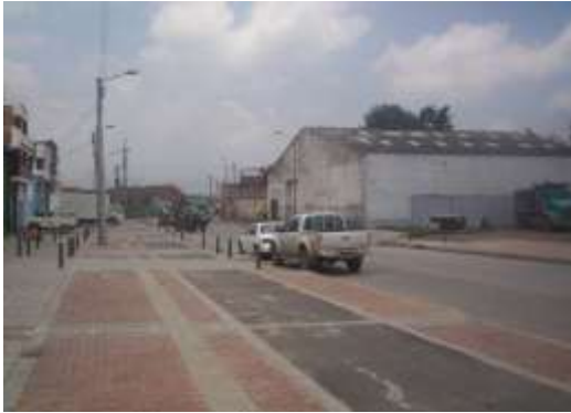
Imágenes 3 y 4. Estado de avance Avenida Mariscal Sucre

Según información entregada por el IDU a la CCB, las obras de la Avenida Mariscal Sucre entre la calle 6 hasta la calle 1 se encuentran actualmente suspendidas. El estado de avance de las obras a abril de 2011 es de 32%.