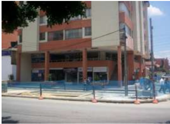
Imagen 17. Obra en calle 114