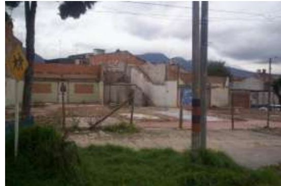
Imágenes 11 y 12. Basuras y escombros a lo largo de la obra