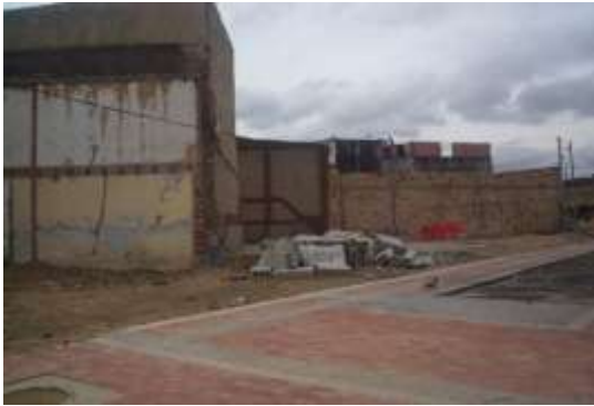
Imágenes 9 y 10. Predios demolidos