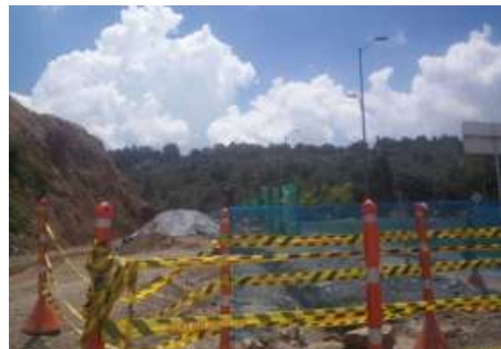
Visita realizada el 29 de abril de 2011.