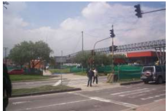
Fuente: Dirección de Proyectos y Gestión Urbana. Visita realizada el 29 de abril de 2011.