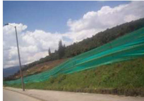
Visita realizada el 29 de abril de 2011.

Según información entregada por el IDU a la CCB, la construcción de la Avenida San José debe terminar en el mes de noviembre de 2011. El estado de avance de la obra a abril de 2011 es de 17%.