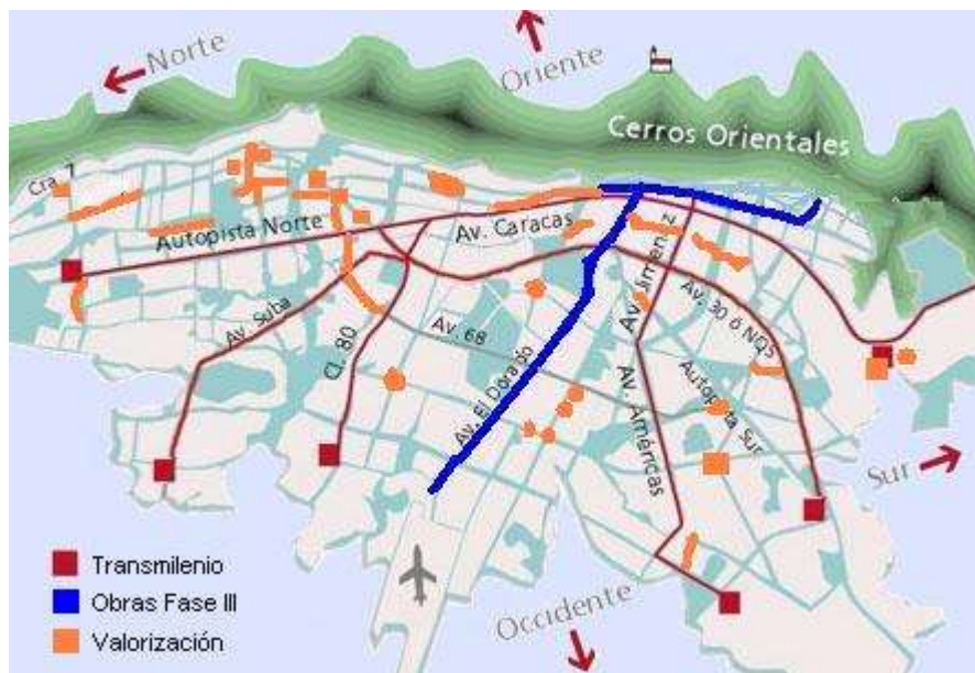
Mapa de obras

De este modo, el IDU quedó a cargo de 38 obras para la Fase I, de las cuales 36 deben quedar en ejecución en el 2009. Como se vio anteriormente, apenas se tenían contratadas 6 obras; las 30 restantes se adjudicaron en el último semestre del año, agrupando algunas para reducir el número de contrataciones.