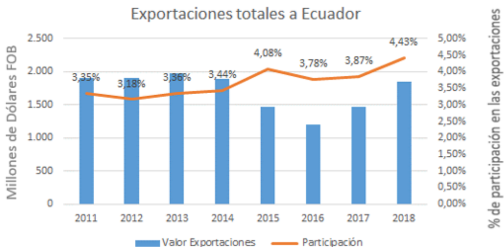
Gráfico 6. Exportaciones totales a Ecuador

Respecto a la industria gráfica, en Ecuador existen aproximadamente 30 importadores de libros que cubren el 80 % del canal de comercialización de libros en el mercado, de los cuales 85 % lo hacen desde Colombia, Argentina, España y México. Colombia tiene