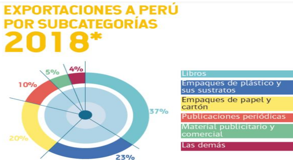
Gráfico 5. Exportaciones a Perú por subcategorías

* Datos suma de exportaciones a Perú por subcategorías hasta abril de 2018.