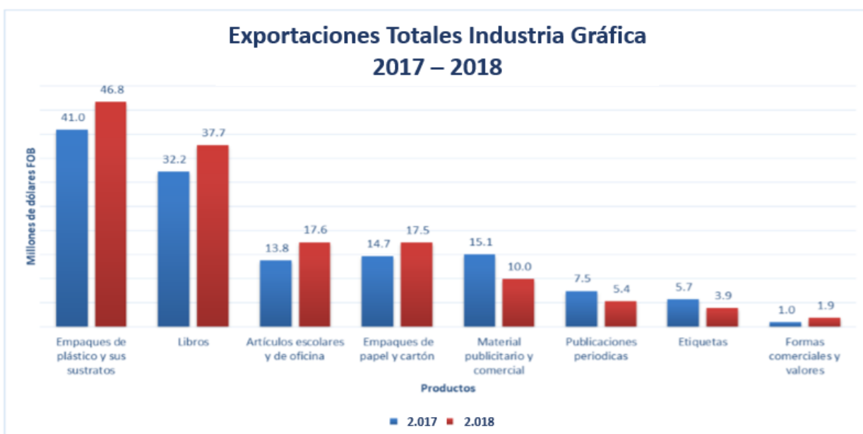
Gráfico 1. Exportaciones colombianas de la industria gráfica

En el 2018 Colombia exportó USD FOB 140.000.000 de productos de la industria gráfica, es decir, 7.4 % más de lo exportado en 2017. Los productos con mayor participación en las exportaciones fueron los empaques de plástico y sus sustratos, seguidos por libros, artículos escolares y de oficina. En términos de crecimiento, los productos con mejor balance en cuanto al valor de las exportaciones entre 2017 y 2018 fueron las formas comerciales (82.9 %), artículos escolares y de oficina (27.2 %), empaques de papel y cartón (19 %), libros (17.1 %) y empaques de plástico y sus sustratos (14.2 %).