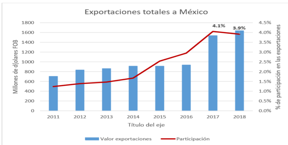
Gráfico 3. Exportaciones totales a México

Colombia es el segundo socio comercial de México en Suramérica, luego de Brasil. De acuerdo con la información presentada por el DANE, el total de exportaciones colombianas a México en 2018 fue de USD FOB 1.638.000.000, lo cual equivale al 3.9 % del total de exportaciones del país.