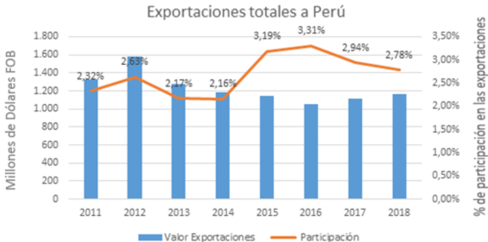
Gráfico 4. Exportaciones totales a Perú

Las exportaciones de Colombia a Perú incrementaron de USD FOB 1.051.000.000 a 1.114.000.000 millones de dólares FOB del 2016 al 2017, además, en el 2018 las exportaciones a Perú ascendieron a USD FOB 1.165.000.000.