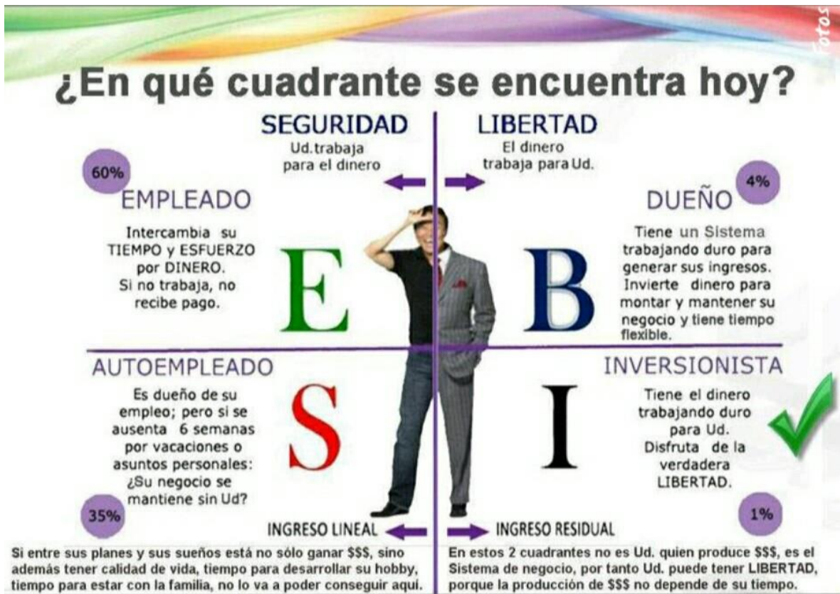
Grafico No 1. Basado en el libro el cuadrante del flujo del dinero de Robert Miyazaki

El Network Marketing se encuentra en el cuadrante derecho, por lo tanto al asociarse a través de una franquicia a una empresa multinacional que provee ciertos productos bienes o servicios, consumir los mismos y crear una red de consumidores se generan ingresos residuales; ya que, cada vez que estos consuman se va generando un ingreso a la persona que creo la red, es decir que trabajando por un período, un networker puede construir una red gigantesca que facture millones y por esto la compañía le va a pagar.