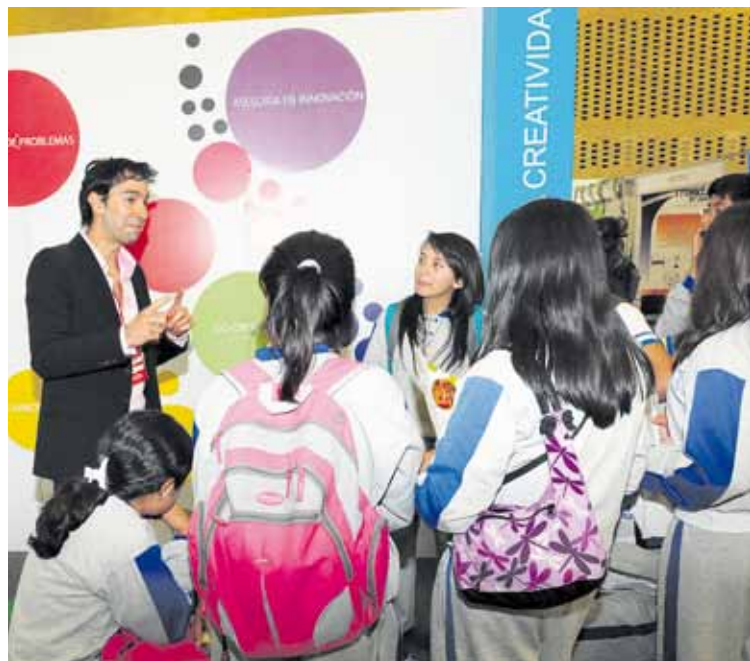
Durante cuatro días, los jóvenes empresarios compartieron con los visitantes de la Feria los beneficios de sus productos y servicios.