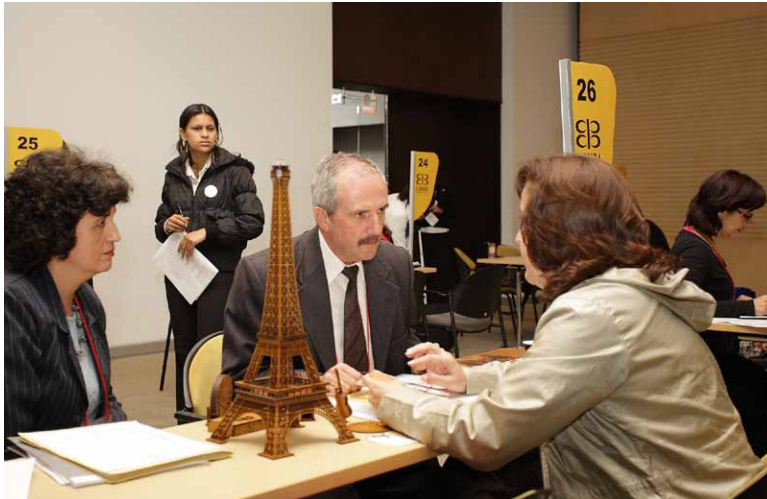
Durante 2010, 1.947 empresas de Bogotá y la Región participaron en ferias, misiones y ruedas internacionales.

El programa Bogotá Exporta de la Cámara de Comercio de Bogotá lo prepara para llevar sus productos a nuevos mercados y ampliar su portafolio de clientes, proveedores y aliados estratégicos fuera del país. Reciba asesoría virtual gratuita, acompañamiento especializado y apoyo para participar en ferias, ruedas de negocios y misiones comerciales internacionales.