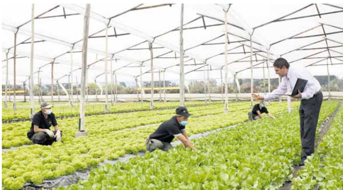
Región Empresaria tendrá una duración de 17 meses y un valor de $1.992 millones.

Con el fin de garantizar el éxito de la transferencia del Programa de Emprendimiento, la CCB realizará una rigurosa labor de entrenamiento y entregará a las cámaras de comercio que implementarán el proyecto, un manual operativo, un manual de servicios, una página web y un modelo de acompañamiento presencial y virtual.