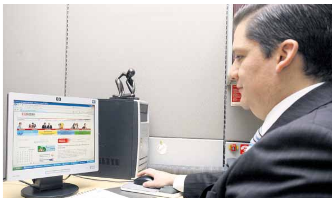
Conozca los nuevos formularios para inscribir, renovar o actualizar su registro mercantil.

Por otra parte, y con el fin de facilitar el acceso a los beneficios de