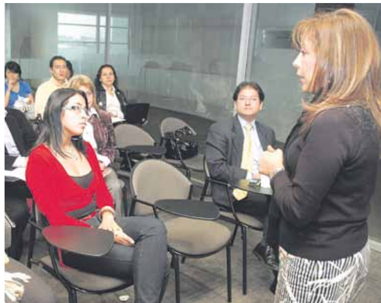
En 2010, más de 3.300 personas recibieron capacitación en bases de datos.

Ingresa a www.ccb.org.co – campus virtual, inscríbese en los próximos cursos virtuales y capacítase en los siguientes temas: clasificación correcta de su producto, Incoterms, pasos para exportar y cómo calcular los costos de una exportación para realizar cotizaciones a precios competitivos en el exterior.