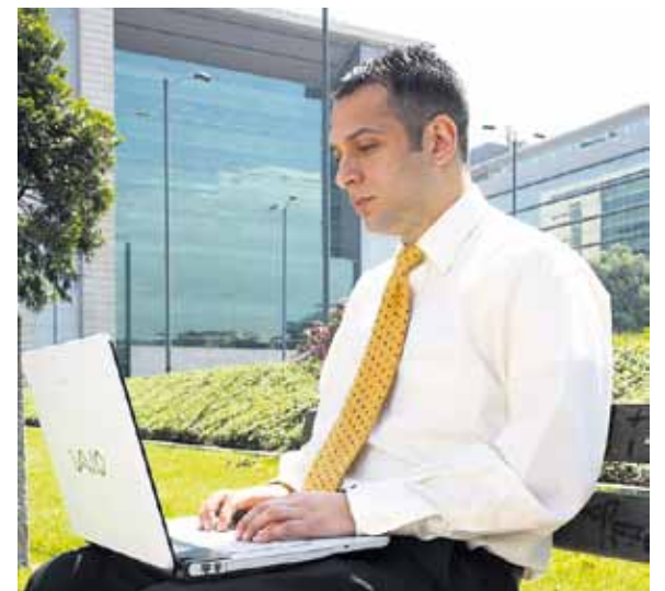
Bogotá Exporta respondió en el 2010 más de 1.690 consultas virtuales acerca de trámites de importación y exportación.

Consulte más información acerca del programa Bogotá Exporta y sus beneficios en www.ccb.org.co