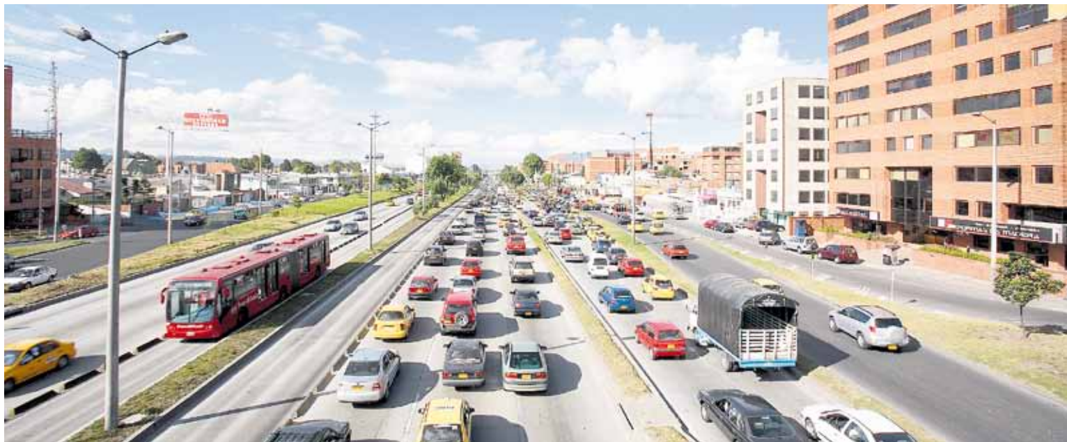
Haga parte de esta iniciativa y participe en la construcción de una ciudad sostenible.

Vinculándose a “Tus propuestas hacen latir a Bogotá” , los ciudadanos pueden aportar a la construcción de las decisiones estratégicas que permitan hacer de Bogotá una ciudad sostenible. La gran propuesta ciudadana será presentada en octubre a los candidatos a la Alcaldía Mayor. Ingrese a www.hacemoslatirabogota.com