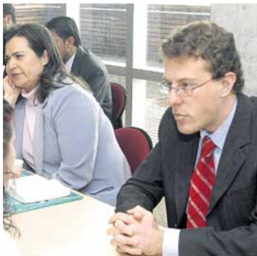
Casos de tipo familiar, civil y comercial fueron atendidos durante la Jornada

Anualmente, el Centro de Arbitraje y Conciliación de la CCB atiende más de 250.000 personas a través de este tipo de programas dirigidos a la comunidad. Para mayor información sobre las próximas jornadas, visite la página web www.cacccb.org.co o acuda a cualquiera de los Centros de Conciliación Comunitaria de la CCB.