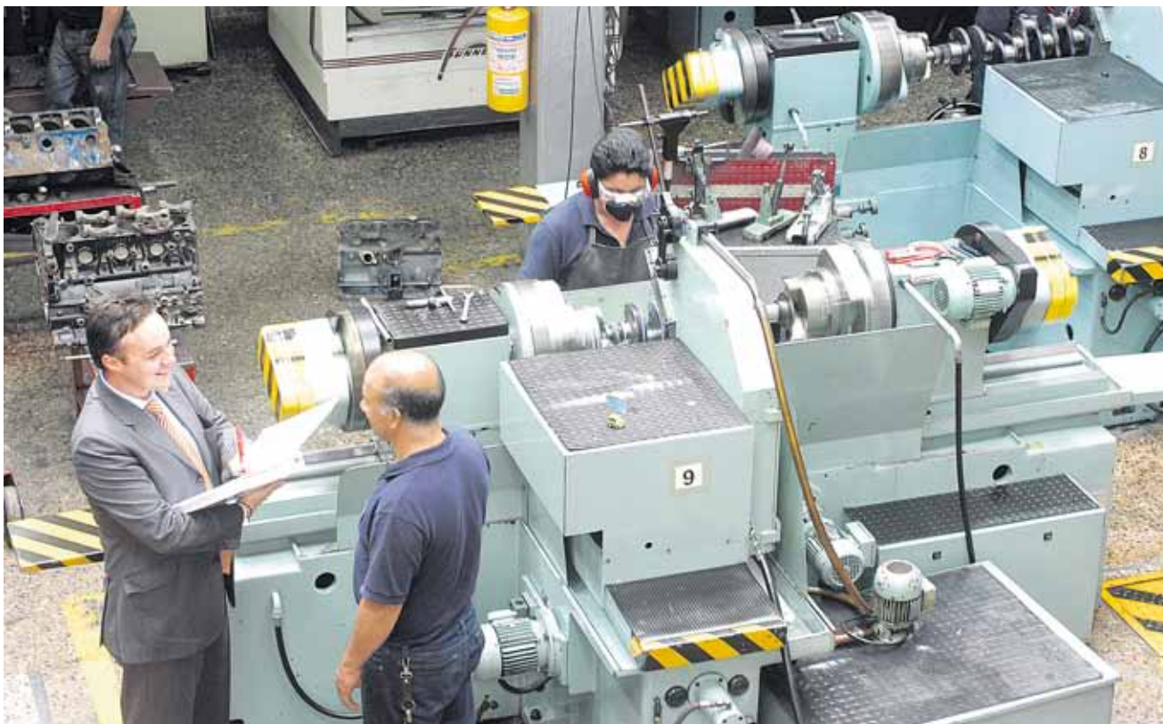
Anualmente el programa Bogotá Exporta de la CCB beneficia a más de 14.000 empresarios de Bogotá y Cundinamarca.

Según cifras del Departamento Administrativo Nacional de Estadística (DANE) durante el año 2010 las exportaciones colombianas alcanzaron un crecimiento del 21,2% en relación con el 2009 y sumaron más de 39.000 mil millones de dólares.