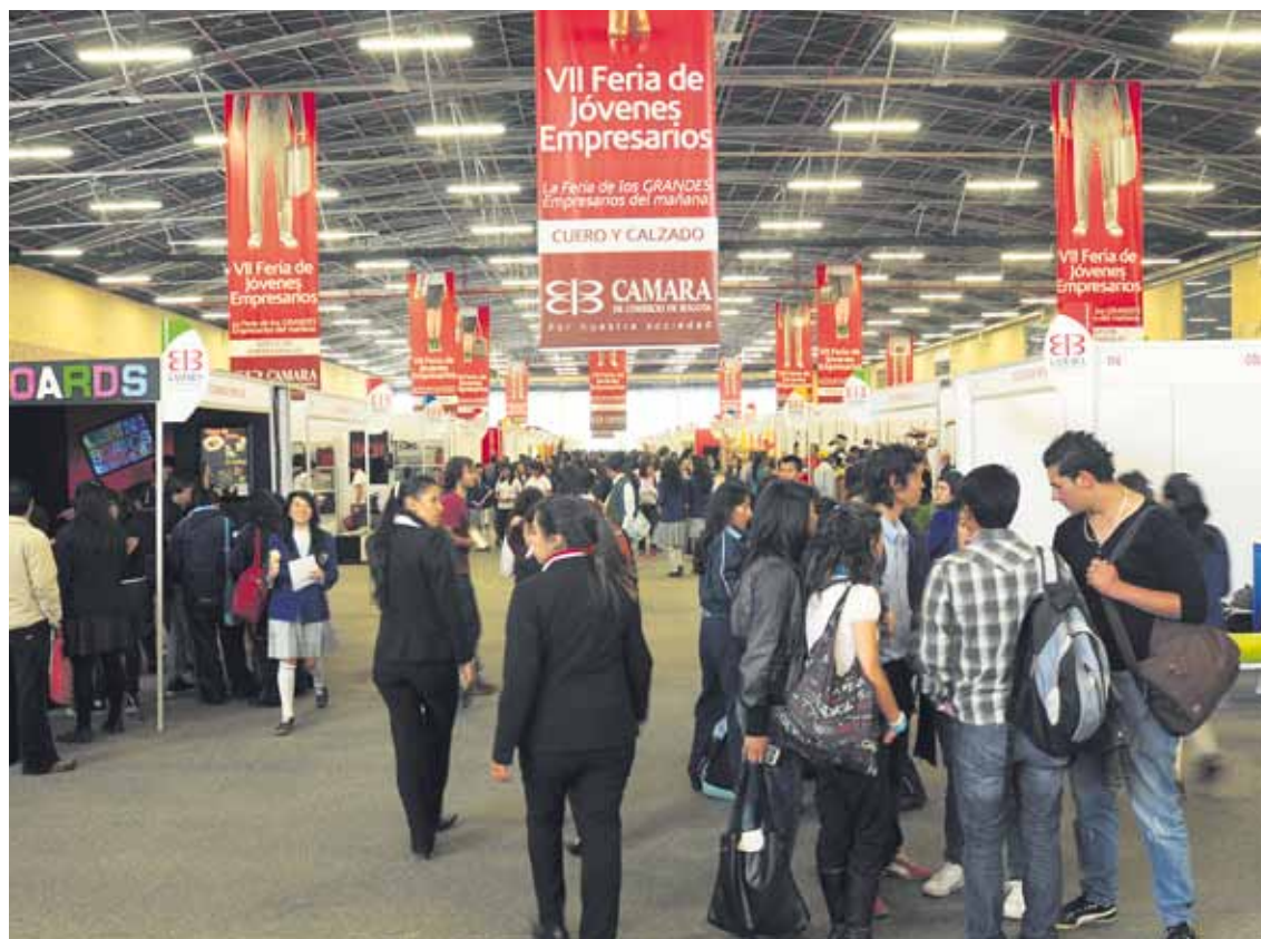
Más de 16 mil personas se acercaron a Corferias para conocer los productos y servicios que de los jóvenes empresarios del mañana.

Adicionalmente, se realizó la tercera rueda de negocios en la cual los expositores asistieron como compradores y oferentes, además de 80 compradores nacionales de 12 ciudades. En este encuentro comercial se cumplieron 1.870 citas (4,25 por em-