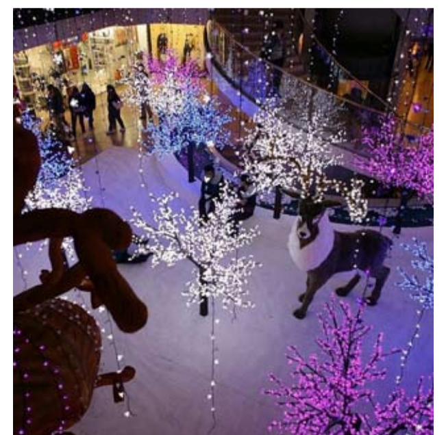
Vitrina del Centro Andino.