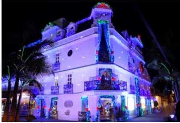
D' Norberto Peluquería