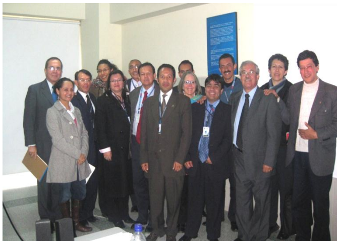
Docentes de UNIAGUSTINIANA, asistentes al taller del 9 y 10 de marzo de 2011.

El taller de Formación de Formadores en Emprendimiento se ha convertido en una estrategia importante para fortalecer las competencias y habilidades de docentes de colegios y universidades, que les permita orientar de una mejor forma en torno a este tema, a los jóvenes interesados en la creación de ideas de negocios.