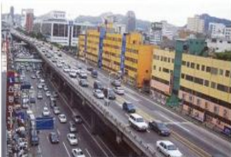
Antes y después de la renovación del canal